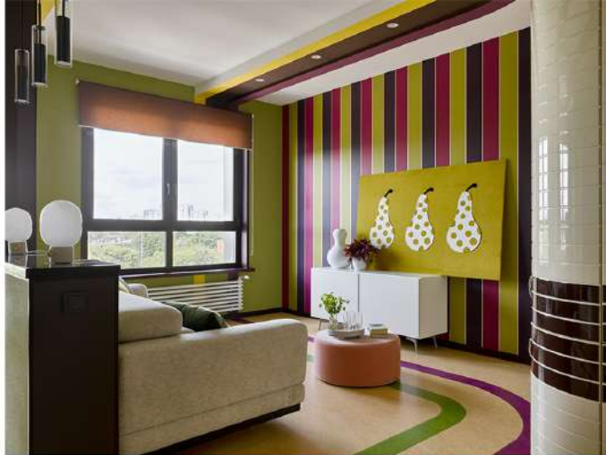
Зона гостиной. Комод, журнальный столик, настольные лампы, ВоСолсерт. Диван-кровать, фабрика мебели «8 Марта».

«Квартира представляет собой правильный прямоугольник с двумя панорамными окнами, — рассказывает автор проекта. — По разные стороны на входе располагались санузел и гардеробная комната. Из-за коммуникаций изменить их месторасположение было невозможно.