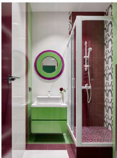
Ванная комната. Мебель для ванной и зеркало выполнены по эскизам автора. Плитка, Tubadzin. Сантехника, Ideal

Поскольку квартира не может похвалиться большими размерами, дизайнер постаралась использовать по максимуму каждый метр пространства. В гардеробной комнате выделила «хозяйственный уголок» для хранения швабр, гладильной доски и прочего. Там же разместили вешалку для верхней одежды и обувную полку. Часть полок «отвели» для хранения несезонной одежды, обуви и чемоданов, которые изготовила компания Ms. Doors.