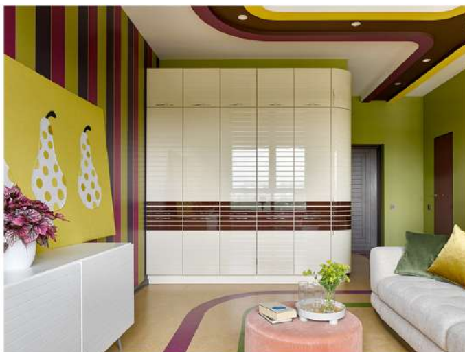
В гостиной установлен шкаф для хранения вещей, выполненный на заказ компанией Kuchenberg Tempo Linea. Стены декорированы обоями от Harlequin и окрашены краской Little Green.

«Квартира представляет собой правильный прямоугольник с двумя панорамными окнами, — рассказывает автор проекта. — По разные стороны на входе располагались санузел и гардеробная комната. Из-за коммуникаций изменить их месторасположение было невозможно.